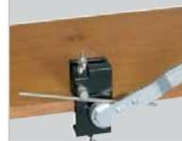
Zamocowanie materiału do gięcia