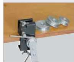
Proces gięcia rurki